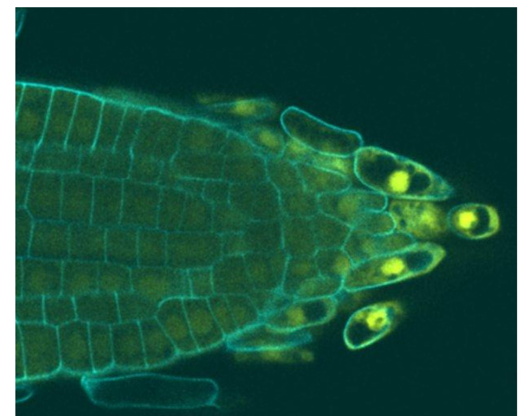
Racine de riz

Lieu: PHIV CIRAD Campus Lavalette BIOS/UMR AGAP (Bât. 2), Avenue Agropolis, Montpellier