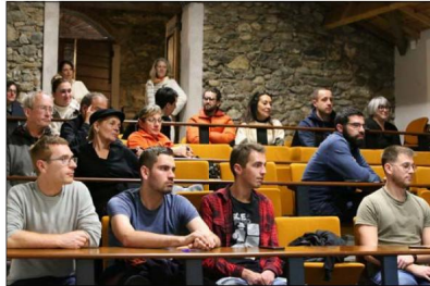
Les partenaires du projet ont suivi avec intérêt la présentation de l'ouvrage.