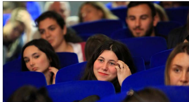
Les séances scolaires sont particulièrement appréciées par les professeurs d'anglais et leurs élèves. CHRISTIAN BUFFA

Afin de lancer l'événement, l'équipe de Studio animation va passer derrière les fourneaux pour concocter à ses spectateurs un petit-déjeuner à l'anglaise. Ces « breakfasts » vont accompagner les séances du matin qui auront lieu ce mercredi 22 et les samedis 25 mars et 1 er avril à 9 h 30. Côté film, c'est Michèle de Bernardi assistée d'Aurélien Renaudin qui se sont chargés de programmer une sélection d'œuvres récentes, inédites mais également une surprise. Ainsi, seront projetés, pendant cette quinzaine britannique et pour la première fois à Bastia : Empire of light , le nouveau long-mé-