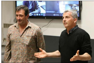
Les auteurs ont présenté leur travail sur les agrumes.

Tous les quatre étaient présents pour parler de leur collaboration, dont deux en visio. Ce qui a permis au public de bénéficier d'une présentation où l'enthousiasme des auteurs était encore bien palpable. À la clé de leur rencontre : l'idée de réunir les territoires des rives de la mer de Ligurie et celles du nord de la mer Tyrrhénienne, dans une opération de mise en valeur de leurs variétés d'agrumes historiques. L'ouvrage fera référence en matière de valorisation des agrumes, allant de pair avec l'essor